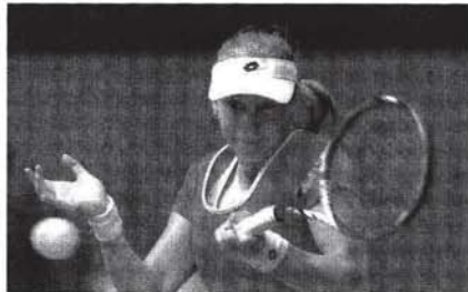
La N° 2 la Russe Ekaterina Makarova toute fière de son second tour.

aujourd'hui pour le compte des huitièmes de finales, la Suédoise Johanna Larsson qui a disposé, auparavant, de la croate Donna Vekic sur le score de 6/2-6/2.