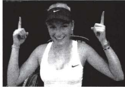
La Croate Donna Vekic ne s'attendait pas à une sortie prématurée.