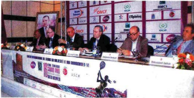
La table d'honneur de la conférence de presse.