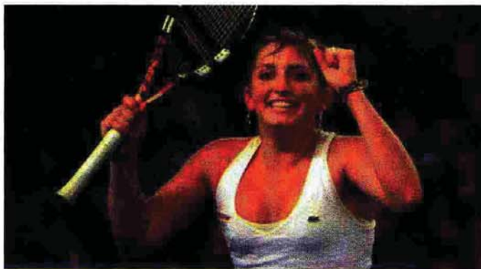
La N° 1 du tournoi, la Suisse Timéa Bacsinszky, 21ème mondiale.