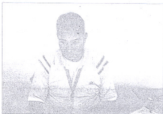
Le juge arbitre du «Sikaki Futures», l'Égyptien Khaled El Sergany

La 3 e édition du Tournoi International de Tennis qu'organise l'USCM, le Club des Cheminots, a démarré samedi 1 er mars à Rabat.